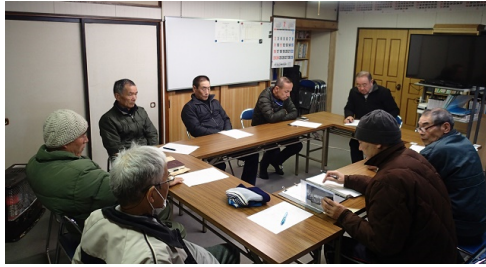
第4回役員会(2月12日)(昨年)

昨年は一関国際ハーフマラソン大会や各地の大会も中止になり会員の皆さんも日頃の成果を出す機会もなく残念な一年だと思えます 新年度に期待して総会は下記の通り行います