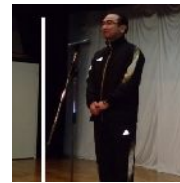
懇親会で歓迎の挨拶の菅原平泉町長