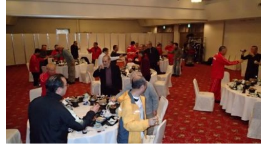
新年を祝してカンパニー