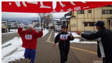
見事ゴールしました