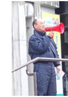
歓迎のあいさつの熊谷部長