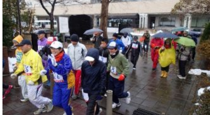
開会挨拶の水室会長と一斉スタート