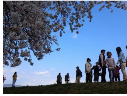
花見客で賑わう磐井川堤防 19日写す