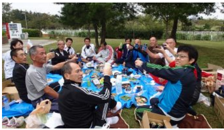
写真は昨年の大会で日報の取材と懇親会

今年の夏は曇りのち豪雨そして暑さ、体調にはこたえた季節でした。河川敷の草花は伸び放題、いつ始まるもしれない堤防改良工事、一関市の将来はどうなるのでしょうか。 今年も33回目の一関国際ハーフマラソンが9月28日(日)ユードームを会場に田園コースで開催されます。以前に比べて、スター選手の参加がなく物足りない感じがします。走りやすくなっています。沿道の声援は少なく、陽射しや風の影響を受けやすく、走者の体調が気づかわれます、マイペースで走りましょう。 今年も終了後に打ち上げパーティーを予定しています。多くの参加を希望します。