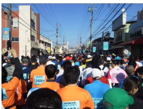
勝田マラソン一斉にスタート