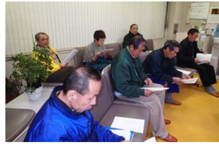
定期総会についての役員会

2月10日氷室内科医院に於いて第4回役員会を開催し平成27年度定期総会議題について話し合いました。27年度には県下交流会はありませんのでそれに変わる事業等総会で決めますので、万障お繰り合わせのうえ是非ご出席下さいませようよろしくお願いいたします。(別途案内)今年度は役員改選期にあたり役員選出があります。