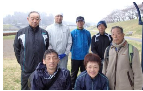
4月例走会に集う参加者

4月例走会兼春季フルマラソンは4月5日遊水池堤防から平泉新衣川橋折返しで開催、雨の中5年振り2人の初完走者誕生しました