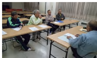
第2回役員会山目公民館

来年は会報3月号で創刊から500号迎えます。また5月に会創立45周年になります。それぞれの記念事業を開催する事としました。詳細はこれから詰めていきます、いい案がありましたら事務局までお願いします。