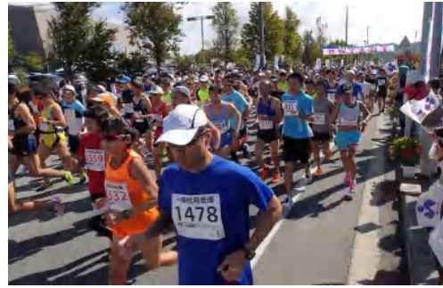
ハーフの部スタート

秋日和の下、今年のハーフマラソンは、9月27日(日)2500余名が参加し、黄金色に輝く田園風景の中を駆け巡りました。