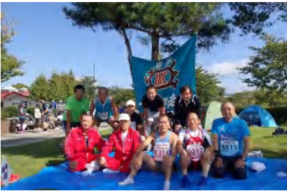
楽走会選手勢ぞろい

3種目最後の10Kスタートから1時間半後の正午、懇親会は簡易店舗が立ち並び駐車場わきで開始されました。参加者は最終