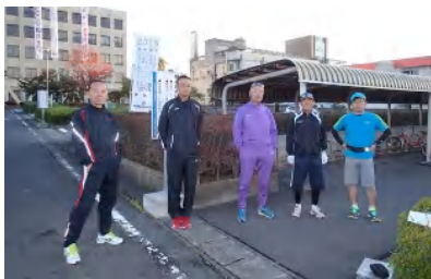
チョット淋しいですね