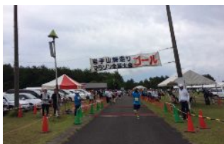
無事ゴールしました