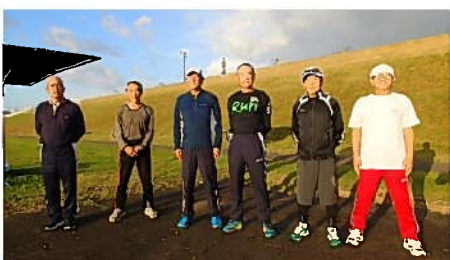
台風一過の秋晴れ下で例走会