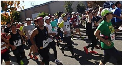
ハーフの部スタート2400名余出走