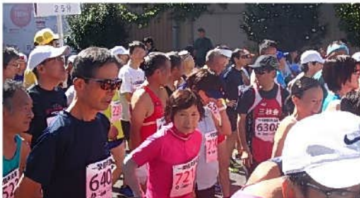
5*の部に240名スタート。一関の仲間もスタンバイ