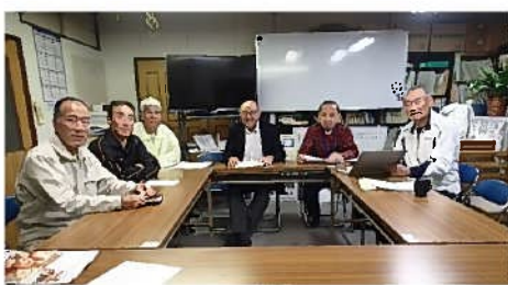
後半事業検討の第6回役員会開催