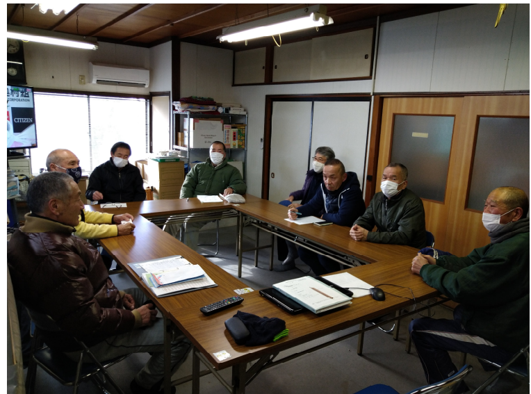
第1回50周年記念実行委員会