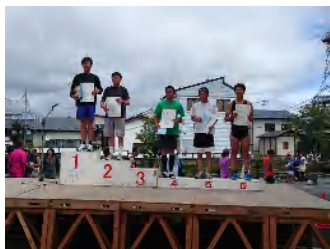
6位入賞表彰台に立ちました

2015年8月24日 久しぶりに遠野ジンギスカンマラソンに参加しました。前日は大曲の花火。一関に帰って来たのは当日朝5時頃。バスツアーだったので運転はしなかったものの狭いシートでほとんど眠れず、家に帰って着替えてすぐに遠野に向けて出発しました。遠野はいつも暑いイメージがありましたが、この日は曇りで涼しいくらい。眠い目をこすりながら(笑)走る私にとっては非常にラッキーでした。