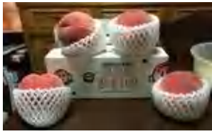
左桃ガールと上名産の桃 走ることが出来た、また参加したいと思います。