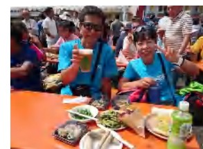
ホップ収穫祭のビール