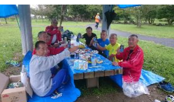
健闘ご苦労様でした