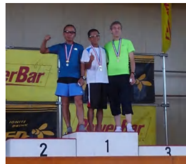
表彰台に立ちました

前回は、フジウルトラの出場ポイント獲得のために50Kロングにエントリーしたが、今回は10Kで楽しむことにしました。