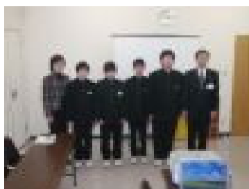
※事例発表する本地部長と部員達